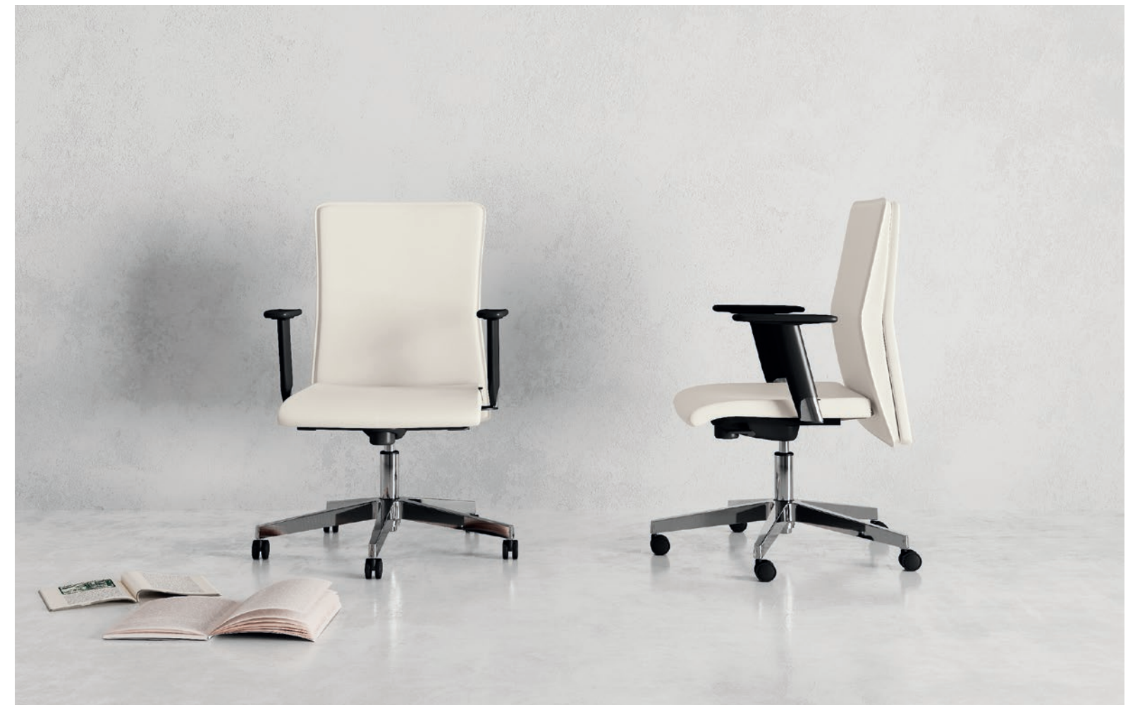
fauteuil de direction